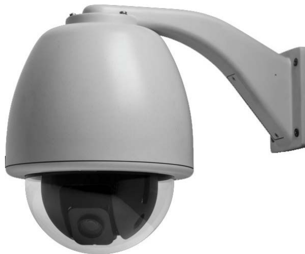
Las imágenes son solo a los fines ilustrativos