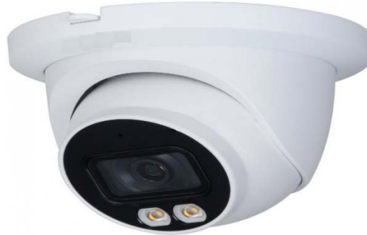
Las imágenes son solo a los fines ilustrativos