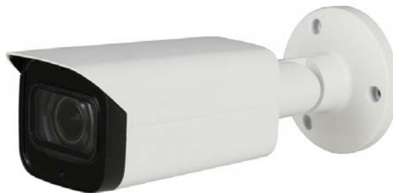
Las imágenes son solo a los fines ilustrativos